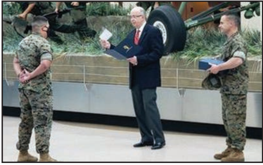
□ □ □ □ □ □

C 8KC □ 88& $ ; ( ( A + $N $DI 1 □ , ! $&& 2 □ 9 ; 6 ' $ □ 0 □ $ 6 O C $ ' □ 6 $ 6 O C $ O □ M □ □ ' □ " □ □ 0 8 1 □ 4 □ " □ □ 9 □ " □ □ A " □ □ ' 4 ! □ !