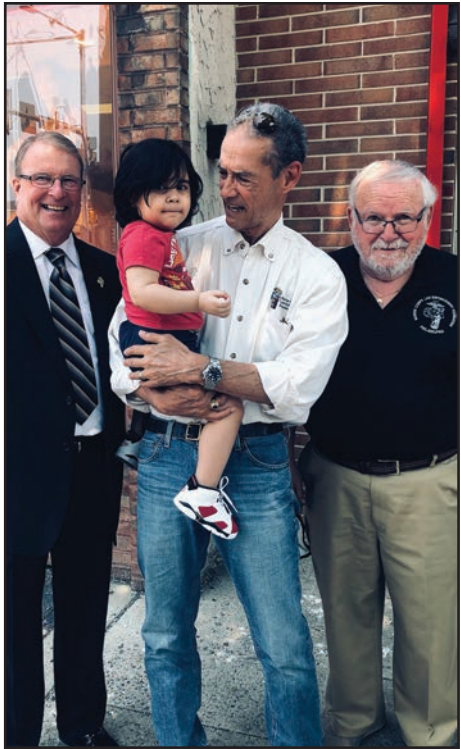
□ □ 2 ! 4 □ □ 4 □ □

) 80 - 5 - 0 8 0 5 - ) 5 -0 5 - - % □# ) 01 : 0 - 0 5 -- 1 0 - - ) 8 B ) C7