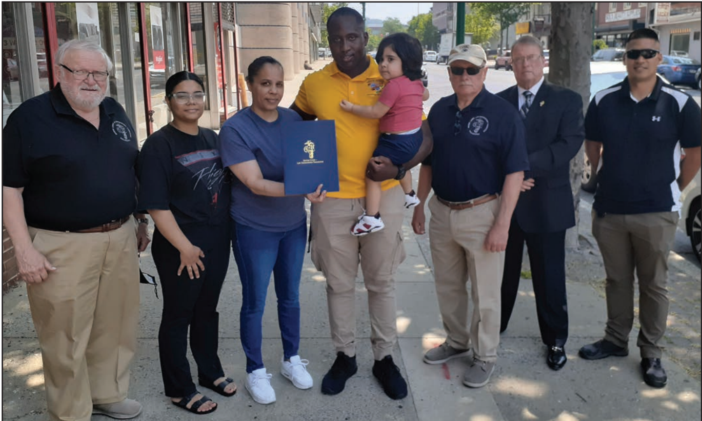
□ □ □ 1 □ 2 □ □ 2 □ □

% 1 A 01 - 0 5 % $ 1 □))1 □ 5 $ 01 )% 3 0 - □ ) 8 % □# ) 0 - - ) )0 8 - $ ) 5 □7- - . - 0 ' 5-□ -0 # 7 08 08 . - 6 - 80 -- - # 1 0 8 50 ) - 0 ) 5 0) 01 0 ) % - $ 0 % 0 08 □ . # 0 - ) - 0 8 0 □ 87 - $ 0: 0 - - 08 ) 050 - -017□ 8 $ 0 . - ) 0 ∞ 0 - . - ) -1 5 % - . - - - 08 0 -7 - 06 5 8 . - ' 5-7# ) - 1 . . 0 0- - - 00 8 - 01 0 ) % - ) . ) 50 - ) 5 1 . - 80 8- ) . 0 ) 0 ) 1 5 ) ) . 01 07□ 8- ∞ ) /8 0 0 -1 8 08 0 -1 . -5 . - . . 0 80 -7(-. 8 0- -- 1 ) . - . - - 8 - -% - : - 0 . 8 0- ) -0 ) - - % □# 5 - - - ) . - -7 . . 0 5 $ 01 - ) - - - 5 % -